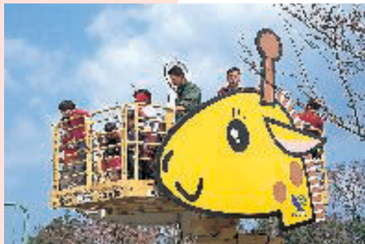
常願寺川公園のイベント