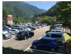
アイドリングストップ監視