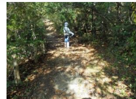
↑ 大観峯自然公園 ← 岩室の滝