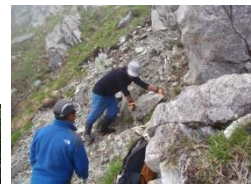
登山道の整備作業