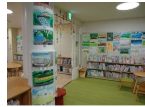
↑ あーとれいんの応募作品