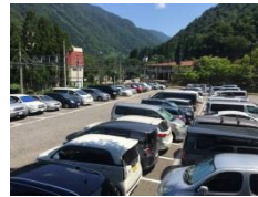
↑アイドリングストップ監視