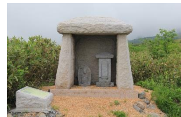
立山参道の石塔並びに石仏群