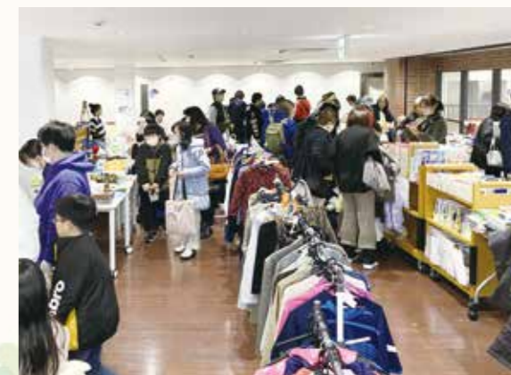
昨年のふくフリの様子