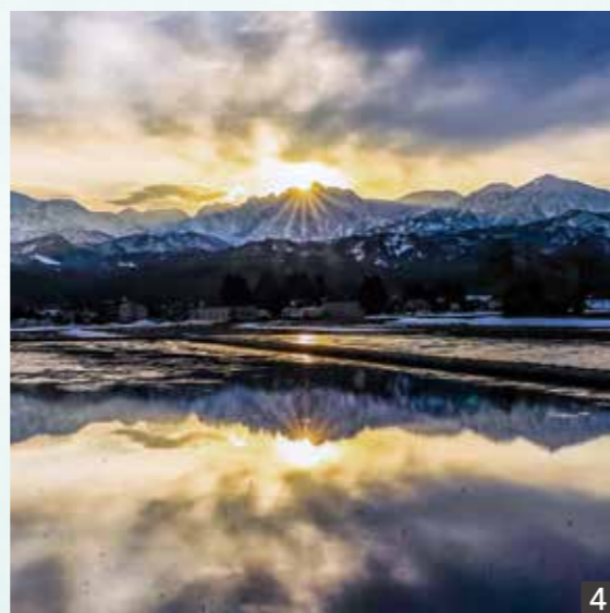
1 2 立山町防災児童館複合施設「アカリエ」 3 立山連峰 水鏡 4 ダブルダイヤモンド劔