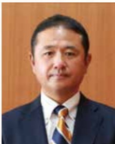
富山商業高等学校 野球部顧問