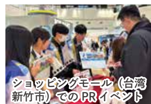
ショッピングモール(台湾新竹市)でのPRイベント

1月13日には役場で報告会が開かれ、生徒たちが現地での体験や学びを振り返りました。