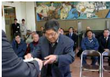
有害鳥獣駆除隊任命式

町長 当面は下田バイパスの完成を優先とし、完成後は、立山インターへ至る町道下田坂井沢線、下段沢端線の県道昇格、及び広域連携道路としての一体的な整備を県に要望している。