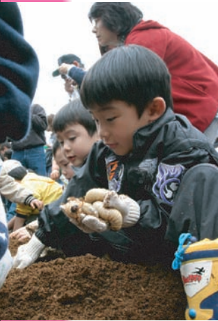
昆虫王国春まつり カブトムシの幼虫掘り体験

いる。 全町での「生ゴミ堆肥化」は、事業の費用に見合う効果、財政見通し等、総合的に検証したい。 EM活性液は、町の小・中学校の池及びプール、農業集落排水処理施設でも利用され、さらに町内の家庭菜園・花壇等での活用も増えてきている。