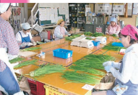
ニラ生産組合(野口)

産業観光課長 その通りだが、続けていくには経営を度外視できない。町としては、付加価値の高い農業を進めていく。