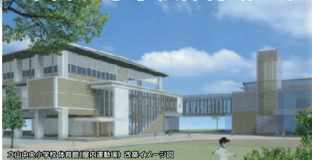
立山中央小学校 体育館(屋内運動場) 改築イメージ図

現在使用している立山中央小学校体育館は、昭和36年に建築されてから45年経過しているため、早くから改築が望まれていた。18年3月定例会で予算が決定され、18年10月工事着工の予定。