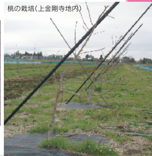
桃の栽培(上金剛寺地内)