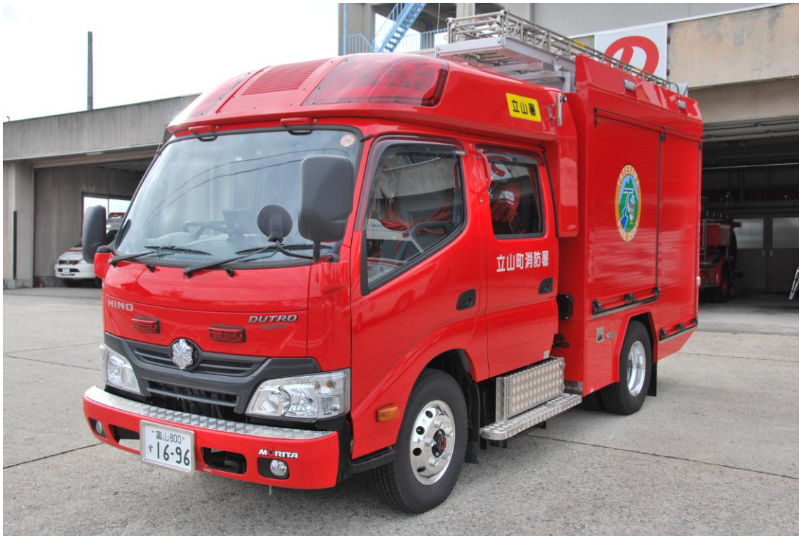
写真：消防ポンプ自動車(CD- I型) 圧縮空気泡消火装置(CAFS)装備 平成25年12月購入整備