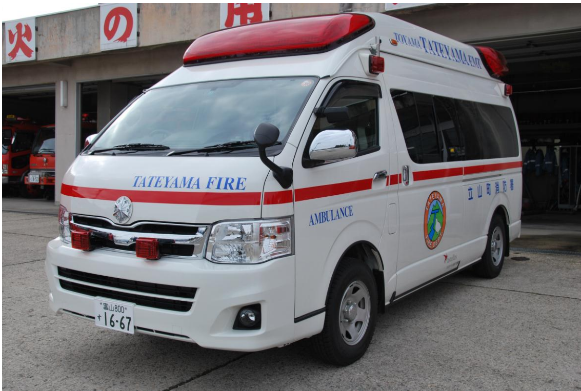
写真：高規格救急自動車