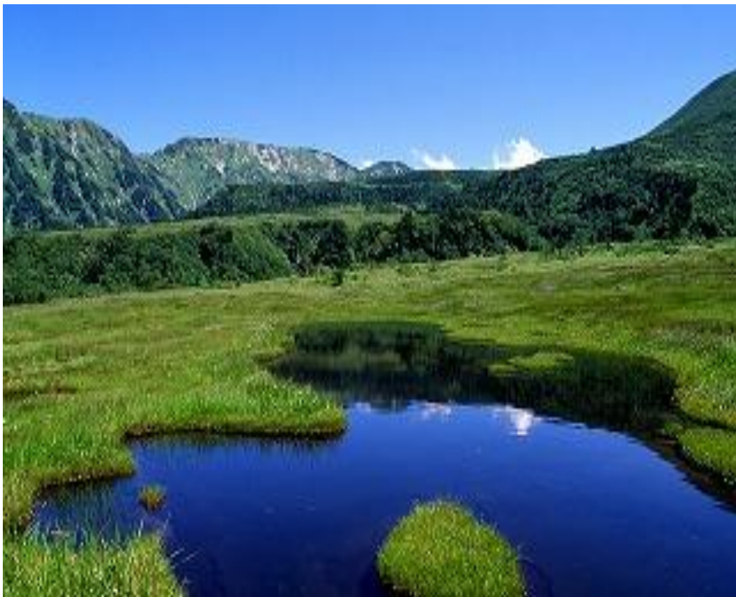
写真：立山弥陀ヶ原（平成24年7月3日 ラムサール条約登録）