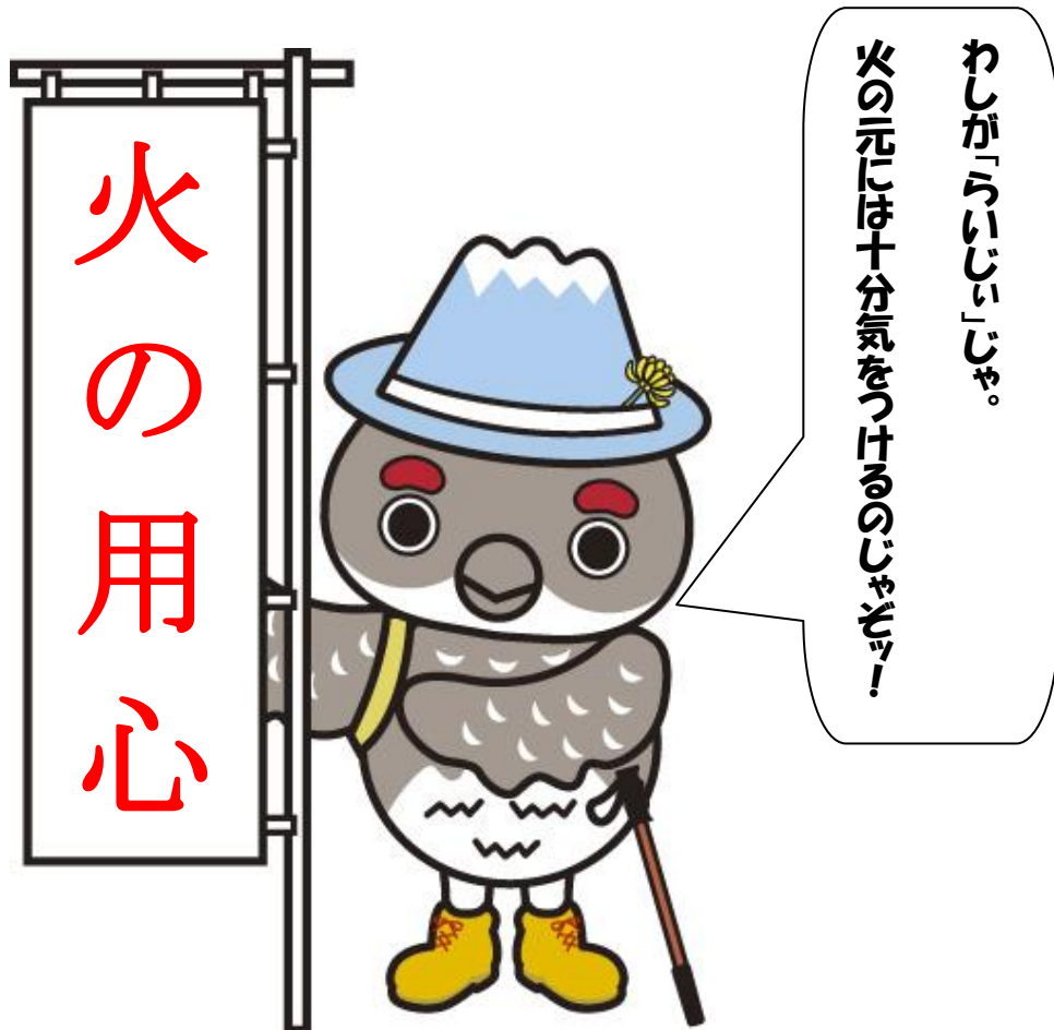
立山町マスコットキャラクター「らいじい」