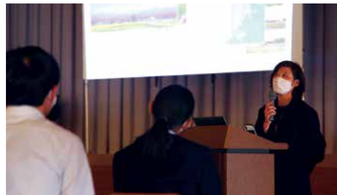
題目「地域ブランディングとデザイン」

教授は、まちなかファームのデザインや特産品のブランド化を手がけた観点から、町の将来像を具体的に描くことの重要性を話されました。