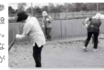
テニスコートの落ち葉を掃除

10月12日、立山町総合公園で、町シルバー人材センター会員らによるボランティア活動が行われました。これは10月の「シルバー普及啓発促進月間」に合わせて行われたもので、この日は約40名が参加。ゴミ拾いや草刈りに取り組みました。参加者からは、「地元の施設なので綺麗になって嬉しい。みんなと会えて、楽しみながら活動できた」との声がありました。