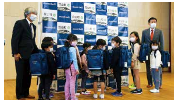
園児13名が代表して参加した贈呈式

「わんパック」は、高額なランドセルが経済的な負担となることから、子育て支援事業の一環として開発されました。パソコンにも対応したサイズ設計で軽量、水にも強く、ランドセルと同等の耐久性を備えています。「わんパック」は、来年度町内の小学校に入学する予定の園児全員に、無償で配布されます。