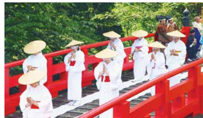
荘厳な雅楽の音色が響く中、布橋を渡る女性たち

参加した女性たちは白装束に身を包み、僧侶の先導に続いて朱色の橋「布橋」を渡りました。橋を往復し、「あの世」と「この世」を行き来することで、生まれ変わりを意味する体験を終えた女性たちは晴れやかな表情をしていました。