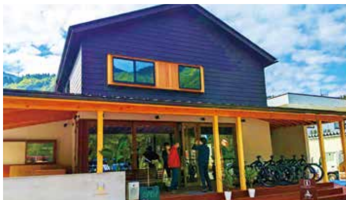
上質な山岳観光地をめざして

10月15日、立山黒部アルペンルートの玄関口である立山駅前に、カフェ併設の2階建て宿泊施設「LOCOMOTION COFFEE & BED」がオープンしました。最大18人が宿泊可能となっており、1階部分には町観光協会の案内所も入居しています。案内所では、坂道でも快適に利用できる電動アシスト付きマウンテンバイク（E-BIKE）の有料レンタルも受け付け、称名滝や立山山麓を自転車で巡るサイクルツーリズムで新しい観光スタイルの確立を目指します。