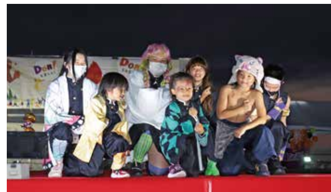
仮装コンテストに家族で参加

特設ステージでは仮装コンテストが行われ、様々なキャラクターに扮した参加者が会場を盛り上げていました。祭りのラストには、1,000発の花火が打ち上げられ、「日本一近い打ち上げ花火」と言われる迫力満点の光景が会場を照らしました（表紙写真）。