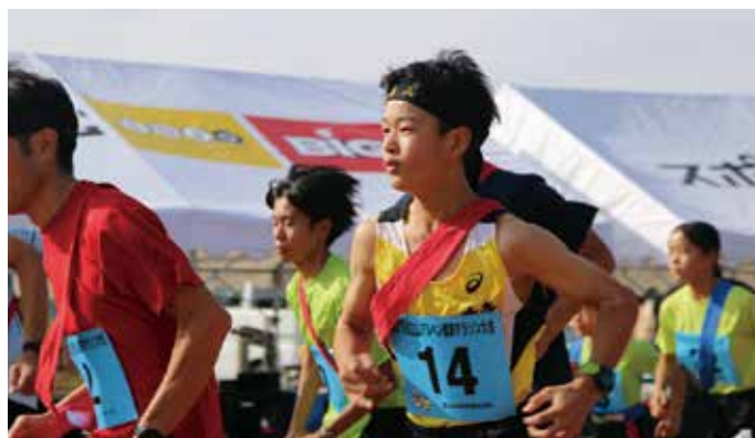
1周800mのコースでたすきをつなぐ

また、同日には第一生命グループ女子陸上部OGによる陸上教室も開催され、参加者たちは走る楽しさやレース前のウォーミングアップの方法について学びました。