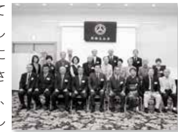
同会の開催は3年ぶり

10月8日、兵庫県にて関西立山会が開催されました。同会は会員数の減少により、これを最後に解散されとのこと。会員らは、「富山弁」が飛び交う楽しい時を過ごされました。