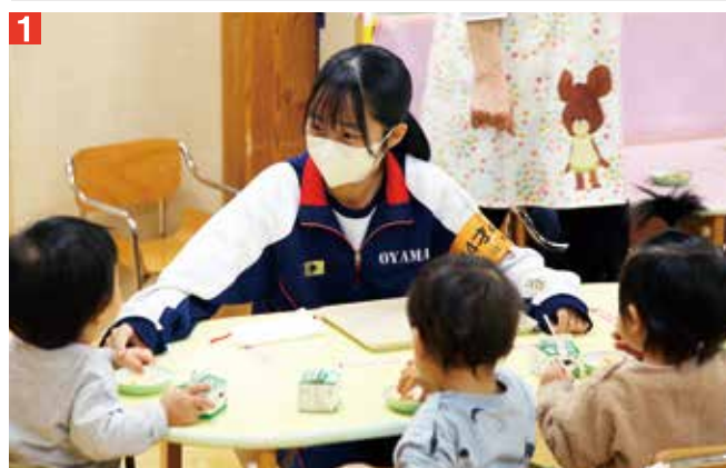
1 1歳児クラスの食事のお世話 2 広報の編集体験をする中学生