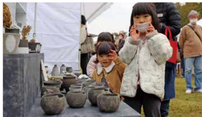
子どもたちも手作りの作品に興味津々

10月22日と23日、「立山 Craft2022」（主催：NPO法人立山クラフト舎）が町総合公園で開催されました。クラフトブースでは計85店が出店し、県内外の作家による選りすぐりの作品が集まりました。立山という土地の魅力を感じてほしい、クラフトという文化が根付いて欲しいという想いから始まったこのイベント。今年はみらいふイベント広場にて映画上映会も同時開催され、滝田洋二郎監督による「おくりびと」などを鑑賞する人たちでにぎわいました。