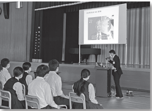
講演する舟橋町長

5月30日、不法投棄の早期発見を目的として、令和4年度の立山町廃棄物不法投棄監視連絡員の委嘱書交付式・出発式が、役場正面玄関前で行われました。