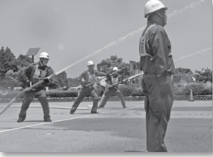
訓練の成果を披露

なお、今回優勝した五百石分団は、7月23日に開催される富山県下消防団消防操法大会に出場します。