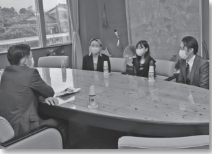
舟橋町長に映画をPR

映画は6月24日に富山市のJMAXシアターとやまで公開され、7月9日には東京都内での上映が始まります。