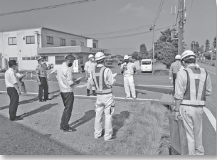
危険箇所の現地確認

今後、他の小学校区や保育所などの周辺道路においても同様の点検を行う予定で、危険な場所などへの対策を検討していきます。