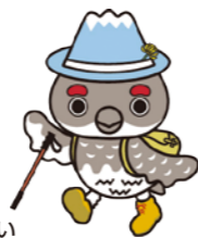
立山町マスコットキャラクター らいじい

富山空港、富山駅に近接し、絶好の立地。 自然災害が少なく、リスク分散、バックアップ拠点到最適。 住環境・子育て環境が充実しているため、 従業員の方々にも安心して住める町。 (学校教育環境は富山県内トップクラス!)