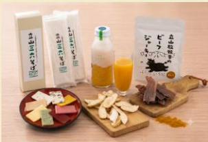
立山町特産品（イメージ）

布橋灌頂会の魅力について、展示や映像を通じて紹介します。期間中は立山町の特産品の販売も行います。