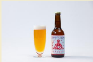
ASHIKURAJI Craft Beer (7/3～7/5限定販売)

会期 7月3日（金）～7月16日（木） 10：30～19：00（最終日～18：00）